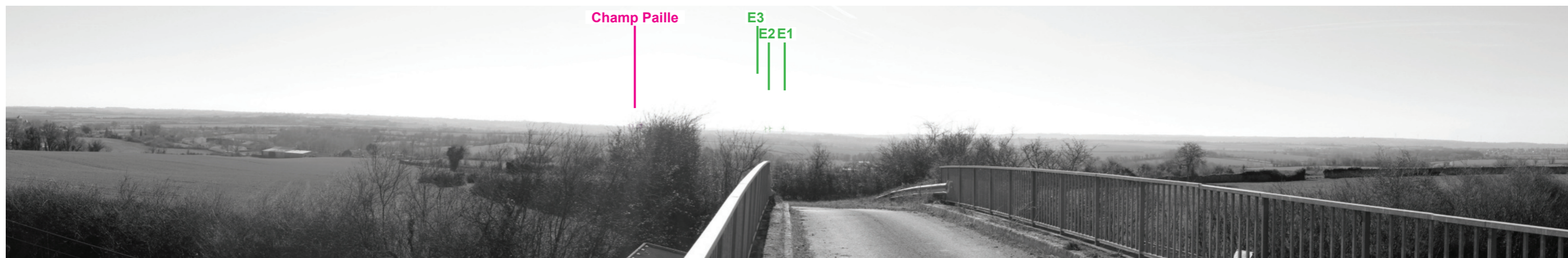
Vue panoramique noir et blanc avec esquisse du projet (angle de vue 120°)

Coordonnées Lambert II étendu : 415044 / 2158427 Date et heure de la prise de vue : 14/02/2019 à 14:34 Focale : 52 mm, équivalent 24 x 36 Azimut vue réaliste : 181° Angle visuel du parc : 1,3° Eolienne la plus proche : E1, à 18 129 m